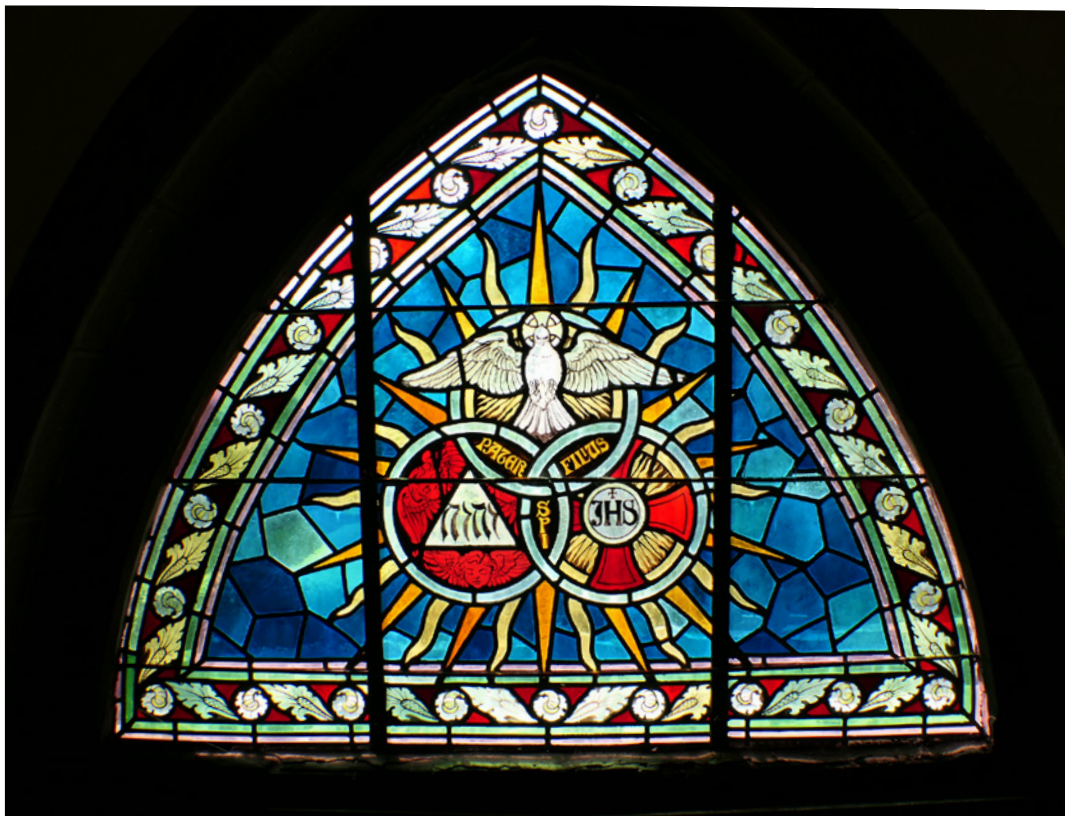
Vue de l'intérieur du vitrail de la porte de l'église Saint Vigor

Bulletin municipal : novembre 2022 Numéro 15