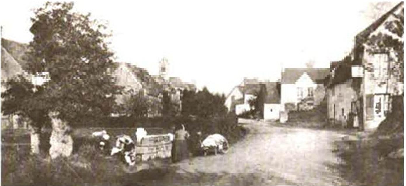
Entrée du bourg au début du siècle

Cette stabilité aura pour conséquence de très nombreuses alliances entre ces familles, ce dont font foi de multiples «dispenses» conservées dans les registres de catholicité.